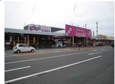
新店 カンセキ神栖店