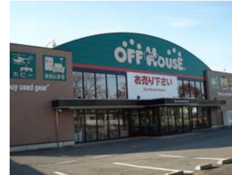
新店 オフハウス鹿沼店