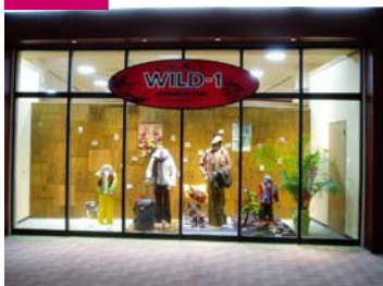
新店 WILD-1印西ビッグホップ店