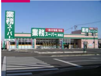
新店 業務スーパー真岡店