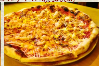
ズワイガニとコーンの焼きマヨ