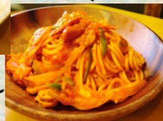
ナポリタン 税込 ¥960