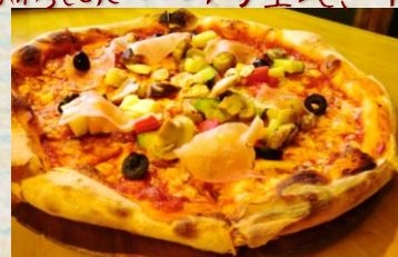
イタリア野菜と生ハム