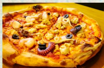
シーフードミックス