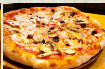
アンチョビ・キノコのガーリック