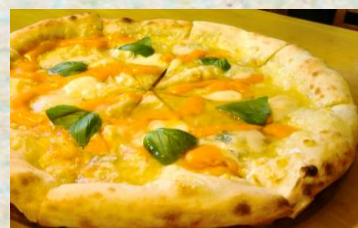
クワトロフォルマッジョはちみつがけ