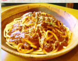
ミートソース 税込 ¥960